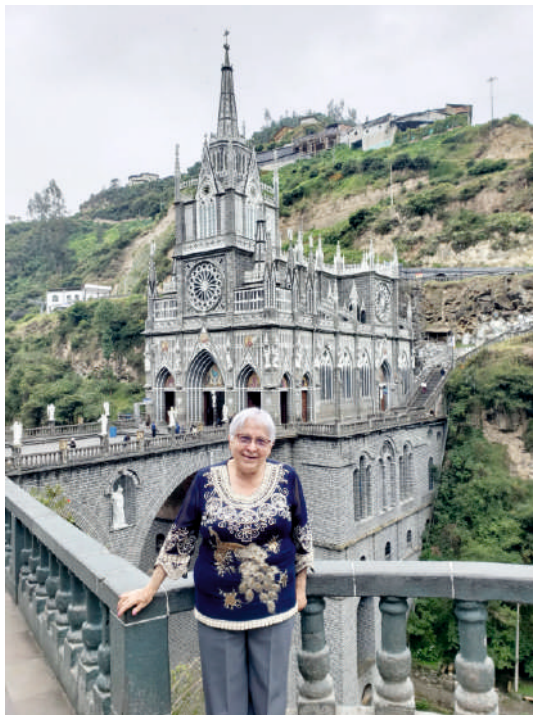
Templo de Las Lajas (Nariño), 06 de Septiembre de 2022