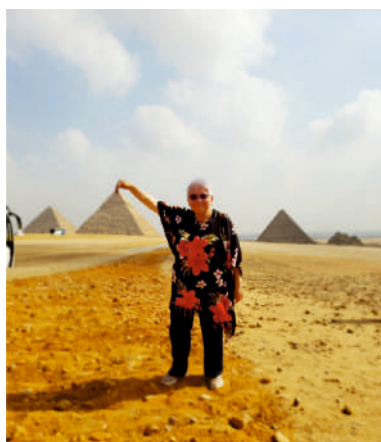
Pirámides de Egipto, 03 de Noviembre de 2022

Su noble, tranquila y conciliadora personalidad con dones y talentos, la hacen un ser de admirar, logrando así llevar a cabo todos sus sueños y metas siempre con creatividad y armonía con todos.