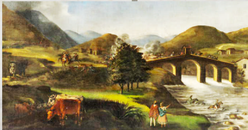
Batalla del Alto Palace

“Mi propiedad, mi familia y mi vida inmediatamente amenazadas en mi propia casa me obligaron a emplear la fuerza para rechazar la agresión; corrió la sangre en esta fatal ocasión, sin que pueda imputárseme responsabilidad de esta desgracia, que deploro y deploraré toda mi vida, lamentando la triste situación de un país en que el hombre honrado y pacífico es compelido a buscar en la fuerza de su brazo y en el filo de sus armas, la seguridad que la ley y la autoridad deben darle. Este hecho me condujo forzosamente a tomar parte en el alzamiento que muchos ricos propietarios de las provincias de Mariquita y Neiva, encabezaron y que secundaron voluntariamente aquellos pueblos, para procurarse libertad de que se juzgan privados. Por consecuencia de aquellos hechos parto hoy al destierro que el gobierno me ha impuesto, parto con mi familia y privado de gran parte de mi propiedad. Un sentimiento indeleble y profundo me acompaña en esta triste peregrinación, y espero que no me abandonará hasta el