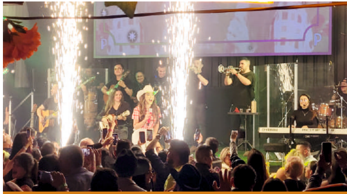
Paola Jara en vivo.

la que también conmemoró su cumpleaños número 41 y, por ende, sus 15 años de exitosa carrera artística en Colombia.