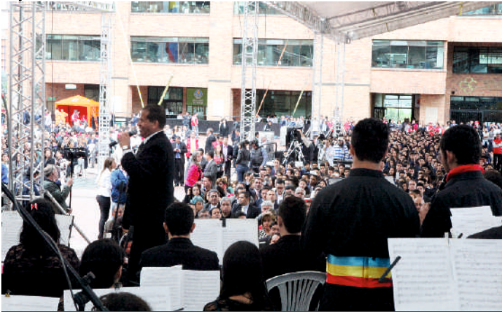
Celebración del Día de Cundinamarca, Bogotá 2014

que tiene un 75% de bambuco; primero, por su alegría, segundo, porque se transmite mucho más fácil, lo que uno quiere decir a través del verso y tercero, porque se adapta muy bien a cualquier tipo de manifestación artística. Para mí, el sonido del tiple en el bambuco, induce a la alegría y, por ende, a la danza. Indiscutiblemente el Bambuco es el papá de todos los ritmos.