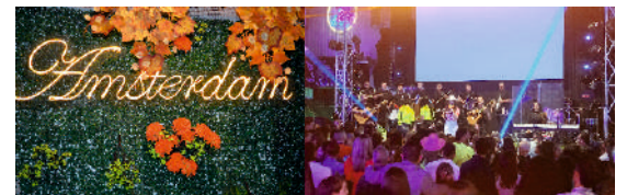
Sede privada Amsterdam de Facatativá.