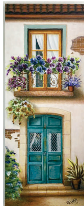
LA VENTANA DE MI TÍA Acrílico sobre lienzo Pinceladas 0.6 m x 1.0 m 2018