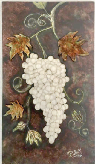
EL PRECIO DE LA VIDA Retablo con textura, monedas y apliques de lámina. Acrílico, brocha seca y óxidos 0.40 m x 0.70 m, 2019

Eurípides Agudelo me ha dado alas y me ha enseñado a tomar oportunidades sacando provecho de las críticas sin miedo.