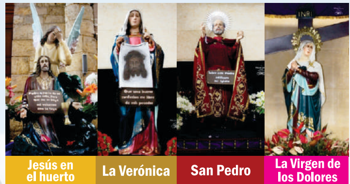
Jesús en el huerto