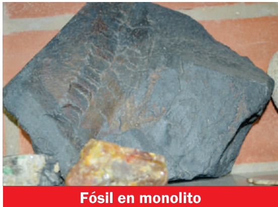
Fósil en monolito

Periódico Identidad Propia: ¿Cuándo y cómo llegó la pintura y el arte a su vida?