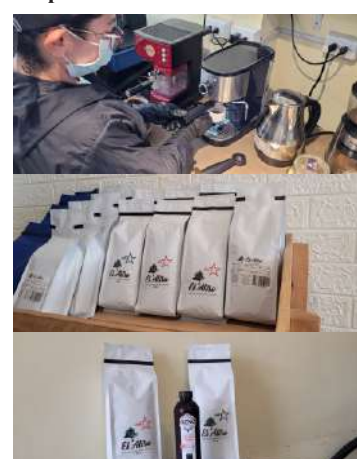
Productos del Aliso Café Tostado de Facatativá

P.I.P: ¿En dónde se puede contactar a El Aliso Café Tostado, para degustar y adquirir sus productos?