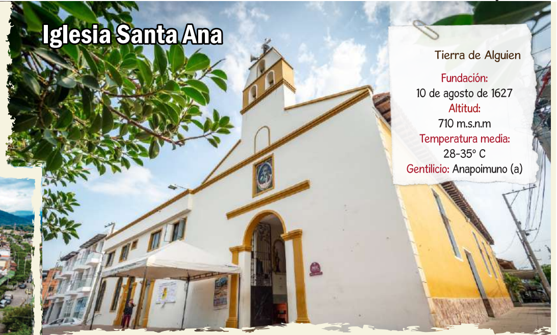
Iglesia Santa Ana

Tierra de Alguien Fundación: 10 de agosto de 1627 Altitud: 710 m.s.n.m Temperatura media: 28-35° C Gentilicio: Anapoimuno (a)