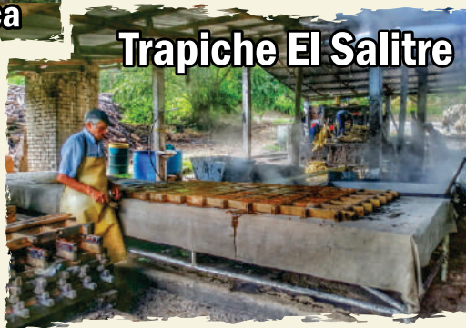
Trapiche El Salitre

Este pueblo Cundinamarqués está ubicado entre frías y fértiles tierras de la sabana de Bogotá y el valle del Río Magdalena, muy cerca de Girardot.