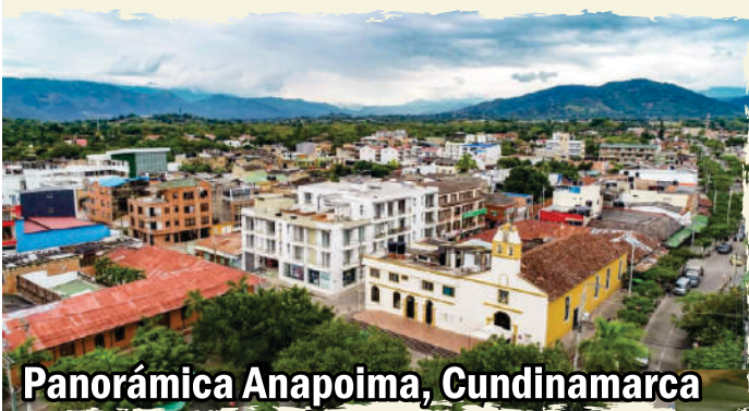
Panorámica Anapoima, Cundinamarca

Tierra de Alguien Fundación: 10 de agosto de 1627 Altitud: 710 m.s.n.m Temperatura media: 28-35° C Gentilicio: Anapoimuno (a)