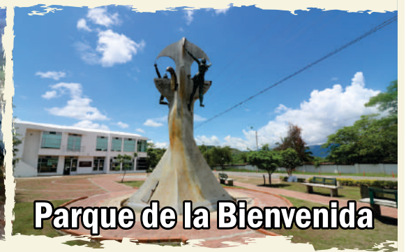
Parque de la Bienvenida