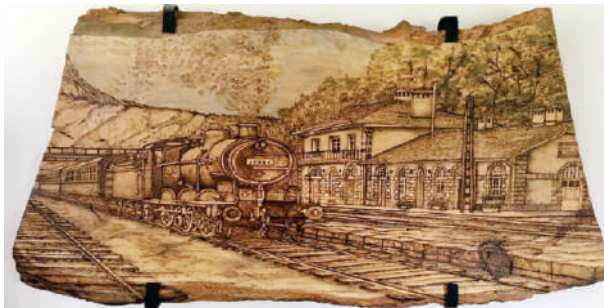
LA ESPERA: Pirograbado y tinte sobre tablón (1.25 a 1.35 m) x (0.60 a 0.65 m) 2019