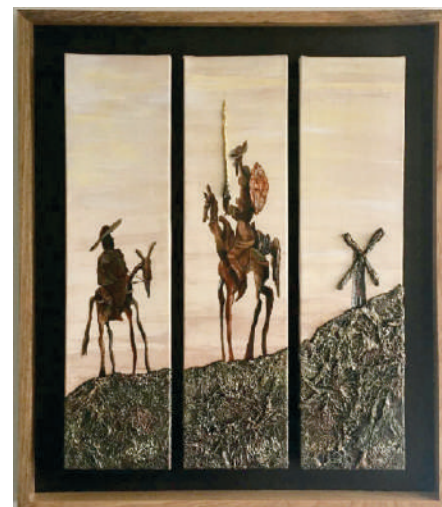
TRÍPTICO DE LA MANCHA: Acrílico, pátina, óleo, hojilla y brocha seca sobre lienzo texturizado con papel seda 0.15 m (0.45 m) x 0.6 m 2019