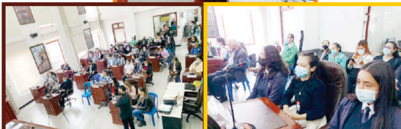
Encuentro por la Libertad Religiosa en Facatativá