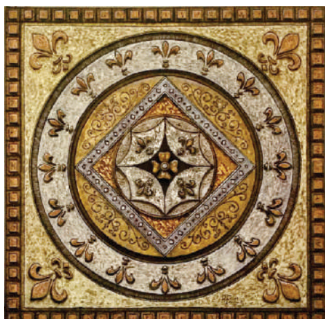
LUZ Y VIDA: Acrílico metalizado craquelado y pátina sobre lienzo texturizado con vitraplom. 0.70 m x 0.70 m, 2020