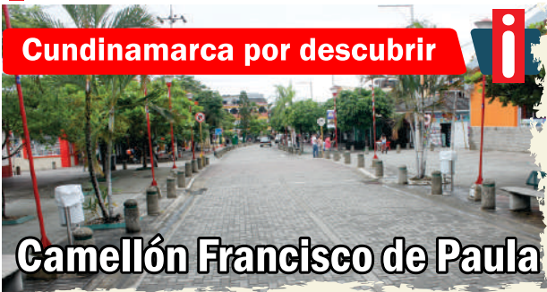
Cundinamarca por descubrir