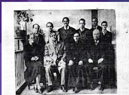
RECTOR Y PROFESORES DEL COLEGIO NACIONAL “EMILIO CIFUENTES” DE FACATATIVA