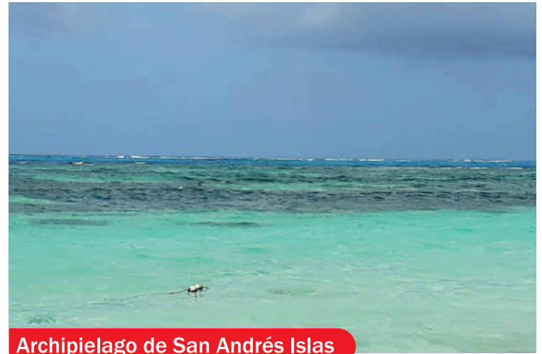
Archipiélago de San Andrés Islas

Dentro de las excepciones, está el uso de bolsas utilizadas para el empaque y disposición final de los residuos sólidos y hospitalarios, las que se utilicen para el procesamiento y presentación de productos alimenticios elaborados en el Departamento, o introducido en él, así como los utilizados para el