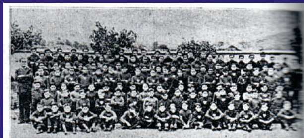
Foto antigua del estudiantado del Colegio Nacional “Emilio Cifuentes” de Facatativá.