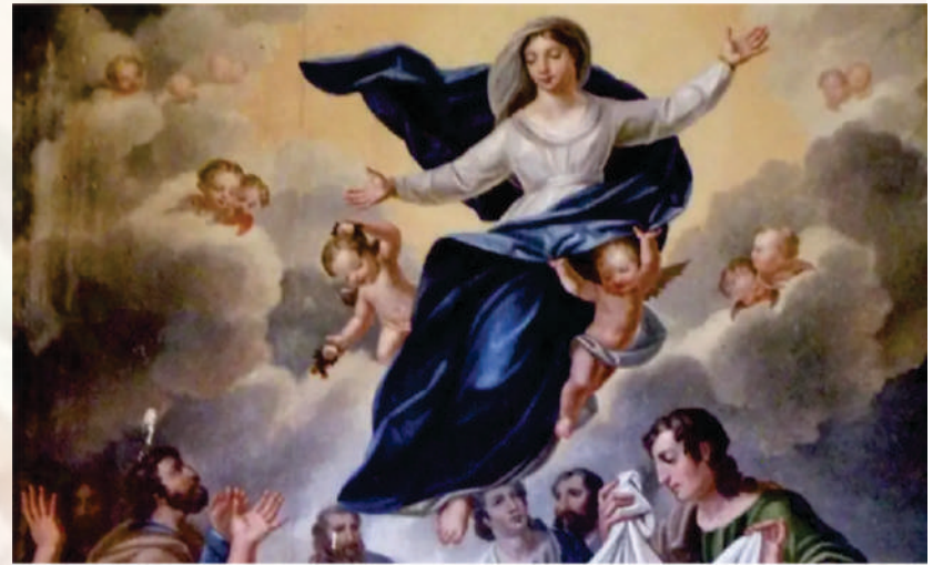
Pintura de la Asunción de María en la Basílica de San Martín de Tours / Crédito: Wikimedia Commons

servidor, acordándose de su misericordia, como lo había prometido a nuestros padres, en favor de Abraham y de su descendencia para siempre». María permaneció con Isabel unos tres meses y luego regresó a su casa. (Lc 1,39-56)