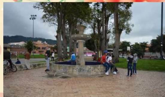
Parque Barrio Obrero Santa Rita