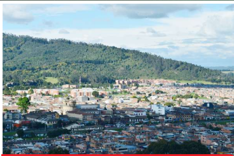
Panorámica de Facatativá